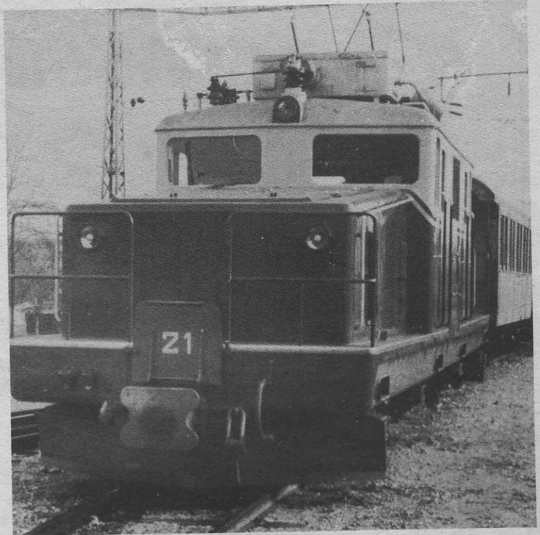
L'impressionnant avant du tracteur T. e. 21 4/4, construit dans les dépôts de la Compagnie.

notre prochain numéro la fin de ce reportage que ous empêche de donner aujourd'hui en entier.