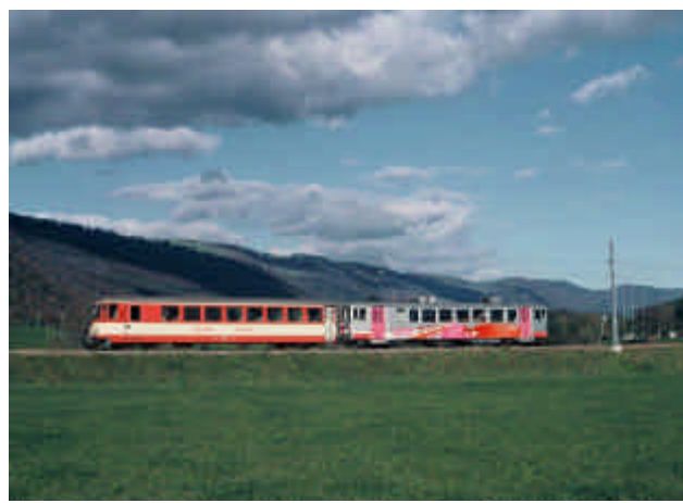
Epoque 4 Be 4/4 4 1994-2008