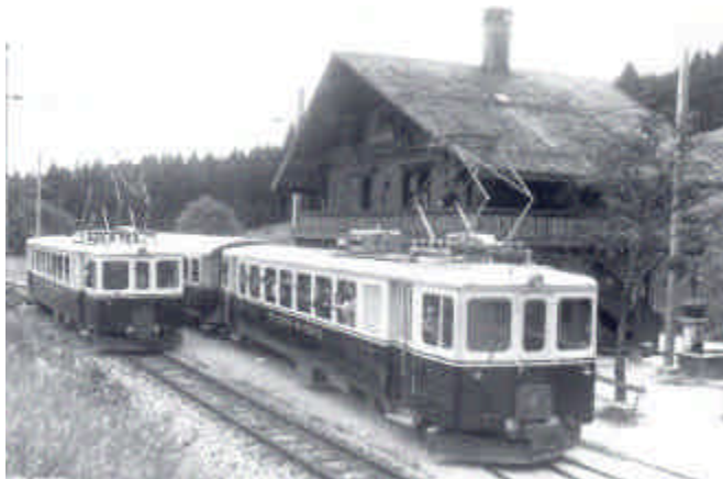
Epoque 1: BCe 4/4 1 1945-1956