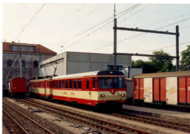
Epoque 3 Be 4/4 4 1981-1994