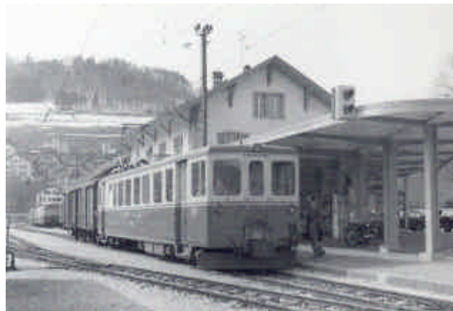
Epoque 2 ABe 4/4 1956-1981